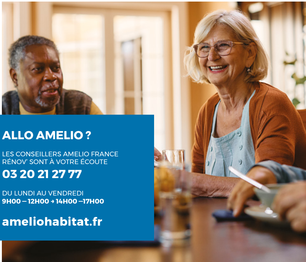
Conception : Bien fait pour ta Com®